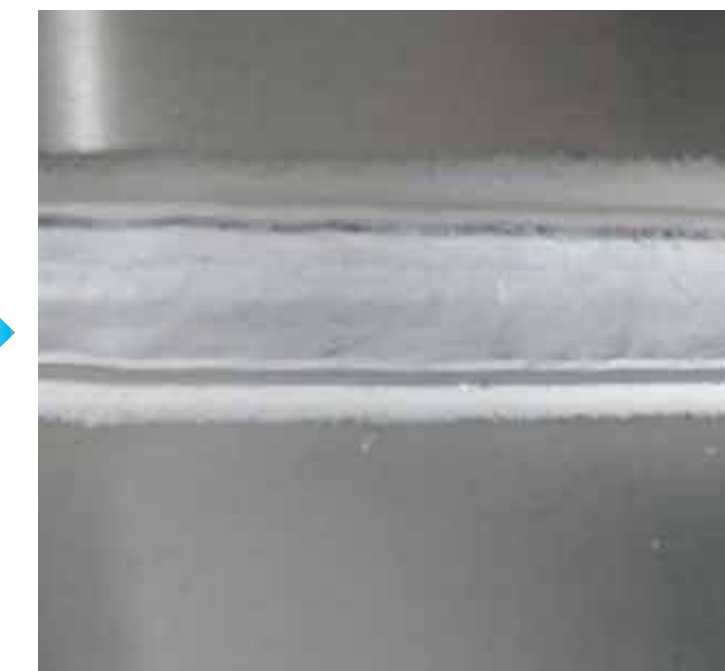
シンクロフィード Synchro Feed 协调送丝