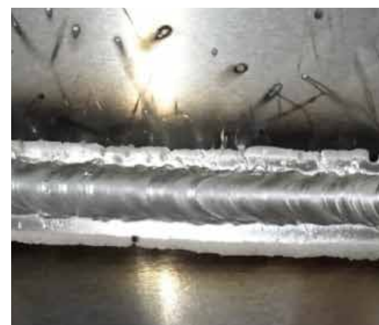
従来溶接 Conventional welding 以前的焊接