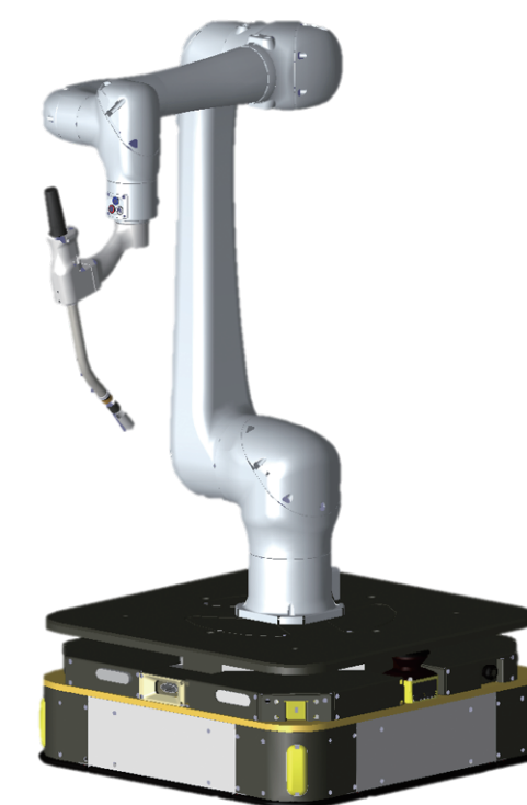
Welbee The Short Arc