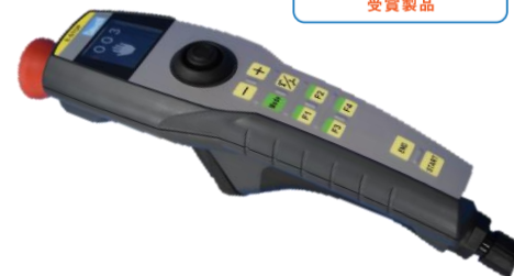
ジョイスティックペンダント -JoyPEN-